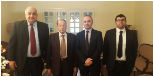
اللقاء مع الجنرال عون

خبر اللقاء مع الدكتور جعجع: http://bit.ly/1Novit1