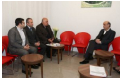
اللقاء مع الدكتور جعجع